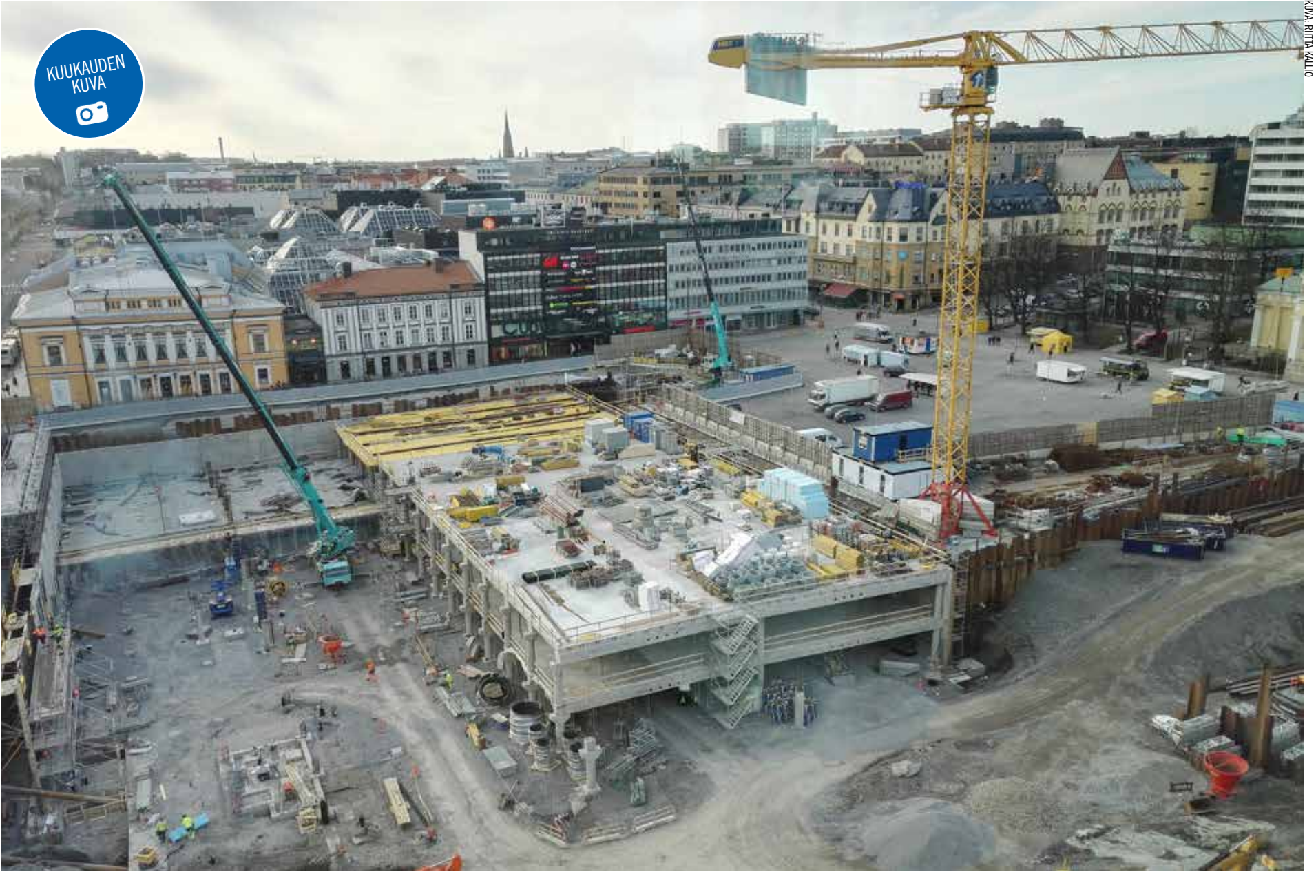
Turku ja Tampere tuntuvat kisaavan siitä, kumman keskustassa rakennetaan nyt enemmän. Turun torille rakennetaan maanalaista pysäköintilaitosta ja liiketiloja. Myös muita mittavia rakennuskohteita on meneillään joen molemmilla puolilla. Lisää TYKS Majakkasairaalan työmaakerrokselta seuraavalla aukeamalla.