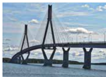
Vaasaan matkaavat voivat käyttää Raippaluodon siltaa.