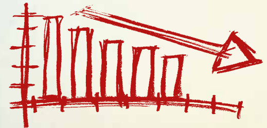
1970-luvulla koettiin sekä työvoiman voimakasta kysyntää että työllisyyden verrattain vankkaa laskua.

[...] Työttömyyskassan hallintoneuvosto kokoontui kertomusvuoden aikana yhden kerran. Tästä kokouksesta kertyi pöytäkirjapykälä 7 kappaletta. Hallintoneuvoston kokouksessa oli esillä vain sääntömääräiset asiat. (toiminta- ja tilikertomus vuodelta 1975)