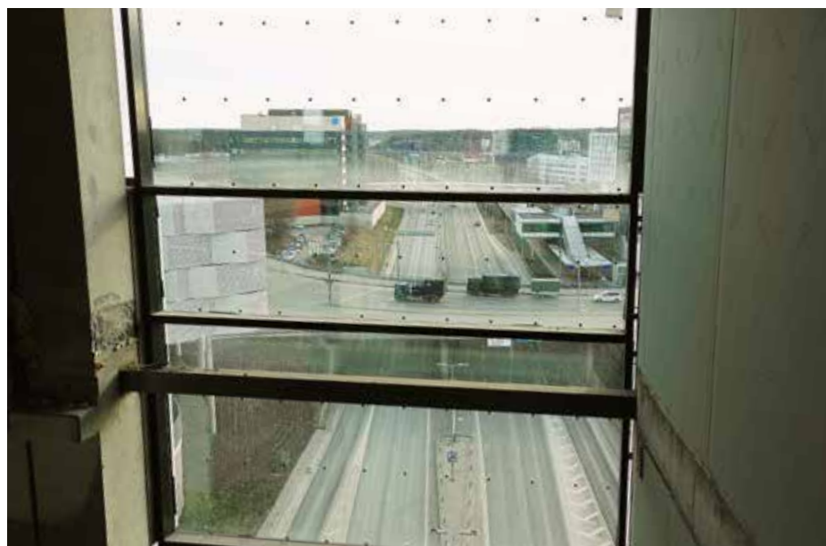
Rakennuksen alta kulkeva moottoritie vastaa Majakkasairaalan tarinassa virtaavaa vettä

Osastotoimitsija käy viikoittain osaston toimistolla Brahenkatu 13:ssa, mutta soveltuvien osin hän tekee työtä myös etänä Littoisten kodistaan käsin. Varmimmin miehen tavoittaa sähköpostilla: osastotoimitsija@sahko41.fi tai puhelimella: 0400 480854. ■