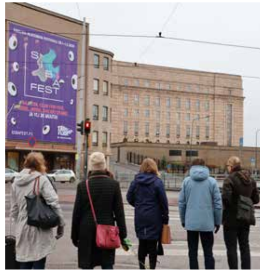
Jos et vielä ole tutustunut Eduskuntataloon, nyt siihen on oiva mahdollisuus Volttipäivien ohessa.