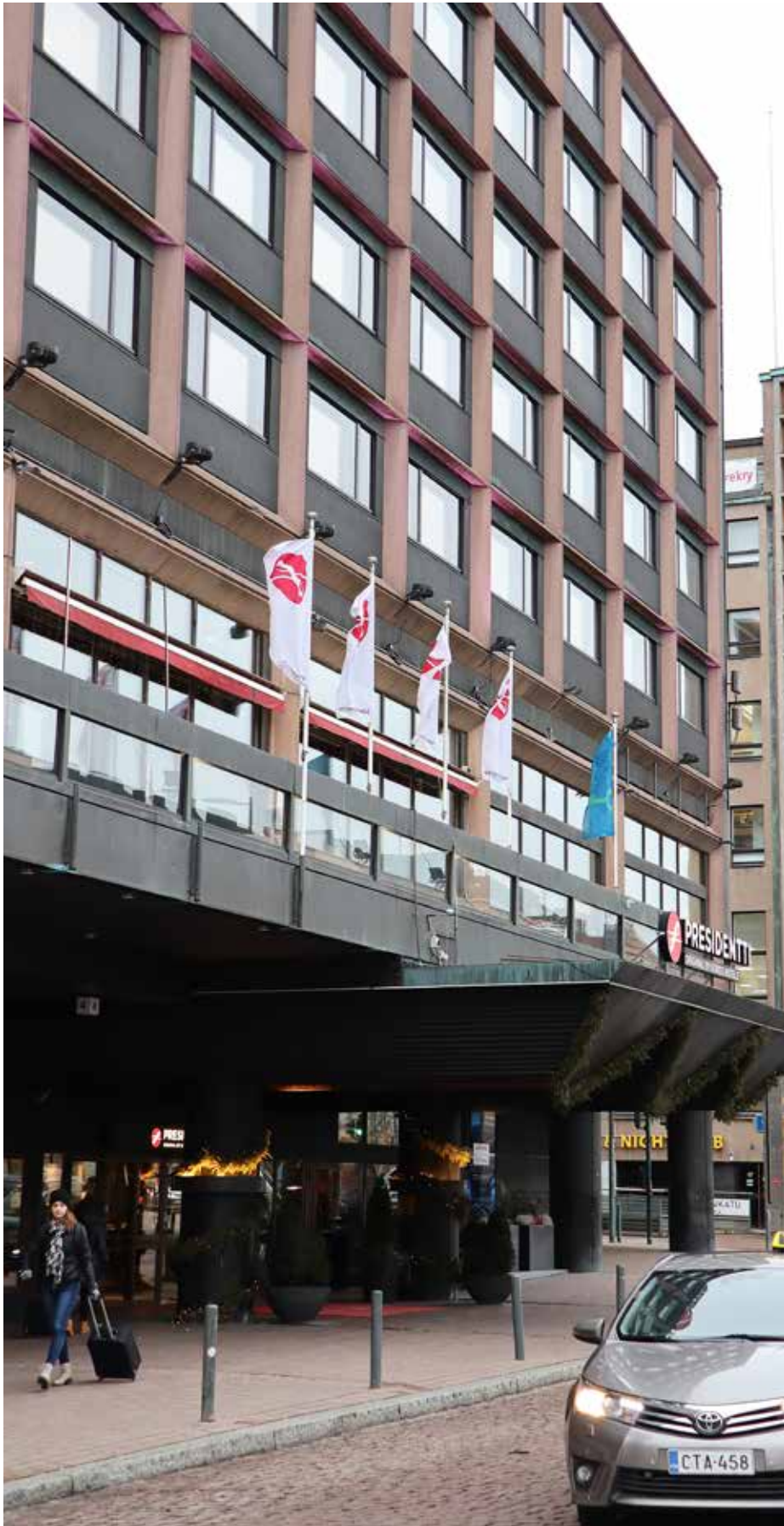
Kansainvälinen Original Sokos Hotel Presidentti on pääkaupungin sydämessä ja monet Helsingin nähtävyydet sijaitsevat aivan sen nurkalla.