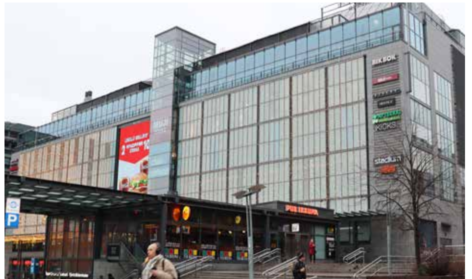
Hotellin kyljessä on Kampin kauppakeskus, jossa vaativampikin shoppaaja pääsee helposti rahoistaan eroon.