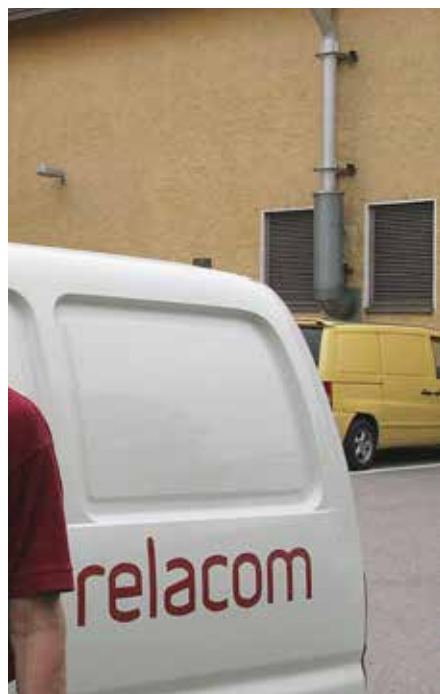
Relacomin logot häviävät Suomen katukuvasta. Konkurssipesän palkkaliistoilla olevat asentajatkin ajelevat jo nyt omilla tai vuokra-autoilla, kun konkurssipesä myy pois kaikkea yhtiön omaisuutta.

Teleliikenne- ja sähköverkkojen asennusta ja ylläpitoa tehnyt Relacom Finland Oy kaatui lopulta velkoihin ja maksukyvyttömyyteen. Yhtiön jättämästä konkurssihakemuksesta ilmenee, että