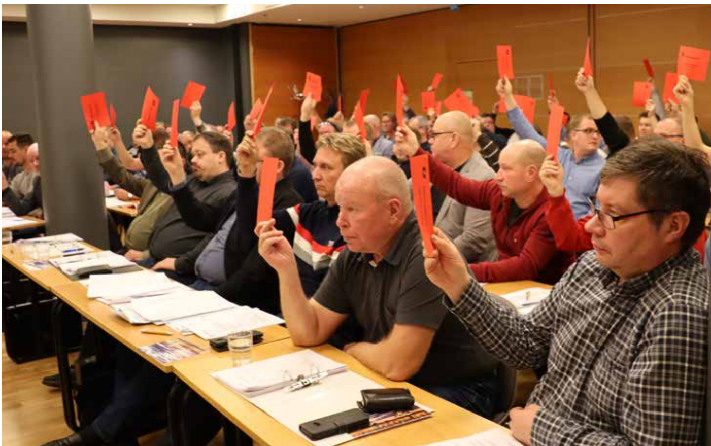
Edustajisto, joka samalla on myös työttömyyskassan edustajisto, oli tällä kertaa niin yksimielinen, että äänestyslippuja tarvittiin vain kannattamaan työttömyyskassan itsenäisyyttä.

Edustajisto oli yksimielinen myös hyväksyessään tilinpäätöksen, vuoden 2020 toimintasuunnitelman ja talousarvion. Toiminnan painopisteiksi asetettiin edustajiston vaalit 2020, onnistuneet työehtosopimusneuvottelut, jäsenmaksutason alentaminen, teollisuuden sopimustoiminta ja jäsenkiinnitys sekä jäsenhankinta. ●