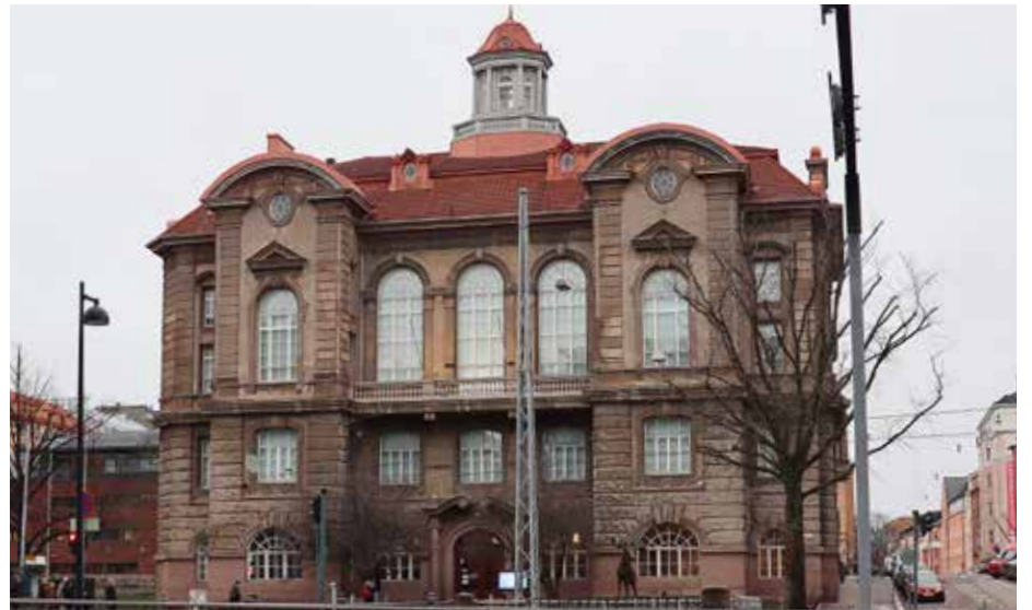
Haluaisitko nähdä dinosauruksen tai sapelihammastiikerin? Eläintieteellinen museo sijaitsee hotelli Presidenttiä vastapäätä.