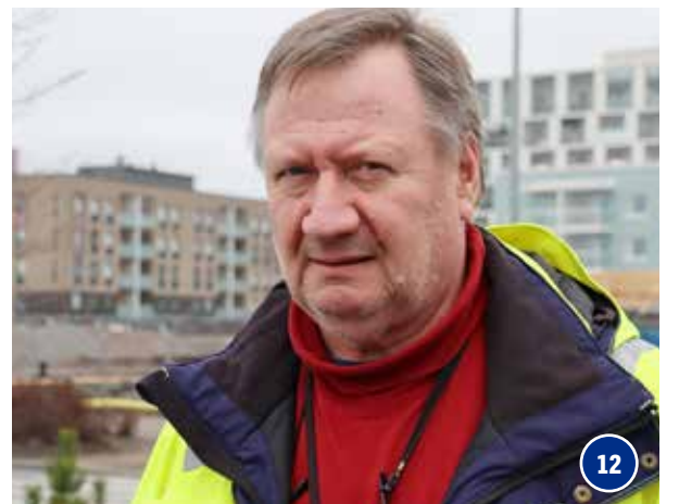
RELACOMIN RANKKA LOPPU LUOTTAMUSMIES VIHAVAISEN SILMIN